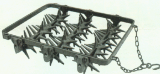
Abb. 2 Marke WKE 1 ohne Fahrvorrichtung