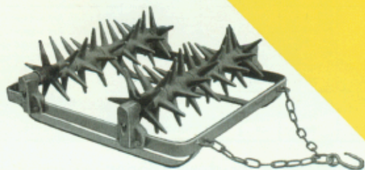
Abb. 1 Marke WKE 5 mit Schleifkufen